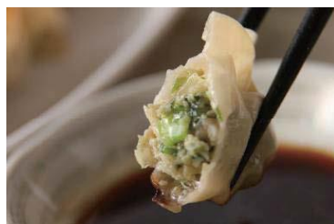
ホクコー 安心・安全・カラフル点心開発