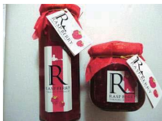
ときいろファーム ベリー加工品開発