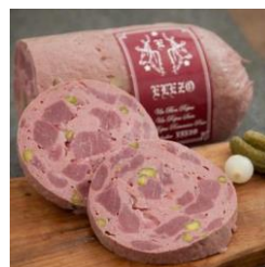
ELEZO社 低利用部位のハム等開発