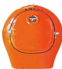
FRPウチャマ 太陽2号S販路拡大