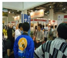
北海道中小企業同友会とかち支部 シンガポール販路開拓