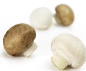
鎌田商事株式会社北海道支店 とかちマッシュの販路拡大