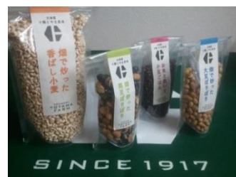
とやま農場 ロゴ・パッケージデザイン